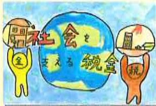
出水地区租税教育推進協議会会長賞