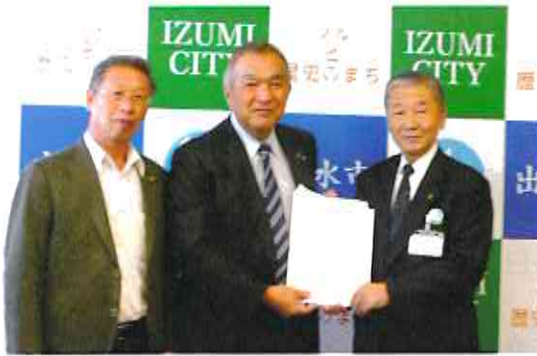
平成29年11月10日 出州市役所市長室にて

法人会の提言活動は、法人税の引き下げなどをはじめ、同族会社の留保金課税制度の抜本的見直し、事業承継に関する税制創設など、中小企業の活性化に資する税制の構築に寄与しています。