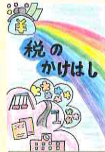
出水税務署署長賞