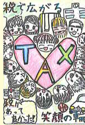
北薩法人会女性部会部会長賞